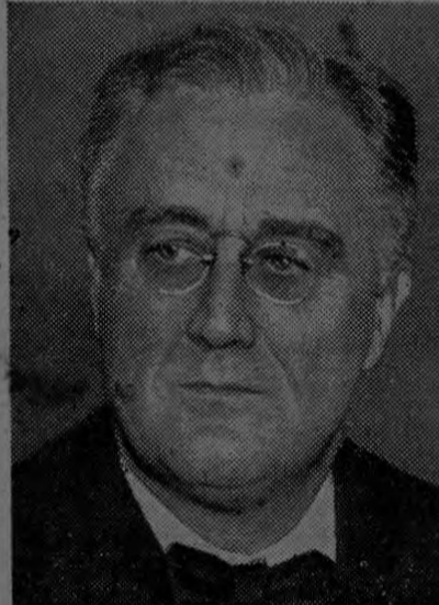
lizado una exploración nacional i- dentífica a la realizada por la Litterary Digest ha informado que los resulta- dos demuestran que Roosevelt gana Pasa a la página 16