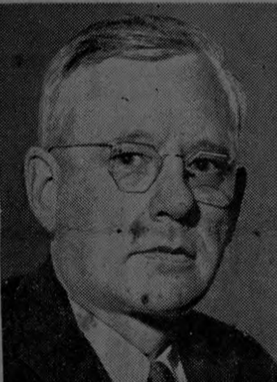
Vaticinios a favor de Roosevelt NUEVA YORK, 2.—El instituto de opinión pública el cual ha rea-

PEMBROKESHIRE, GALES, 2.— que se encontraba al lado del lecho de su madre cuando ésta falleció anoche, cuando cursaba los 91 años de edad.